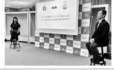
スパイダープラス(港区)は19日、「建設業をもう一つ魅力的にするために」と題したメディア向けセミナーを開催した。

スパイダープラス(港区)は19日、「建設業をもう一つ魅力的にするために」と題したメディア向けセミナーを開催した。 スパイダープラスと共同開催したデジタルツールを使うことで、「図面などの資料の持ち運びが不要で、現場写真の管理も現地ですべて」と説明。また、「作業を適切に行うことをエビデンスとして残せる」ことから、デジタルを使えば仕事が楽になると話し