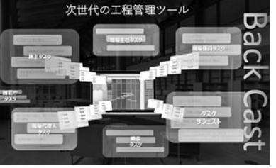
Back Cast Designの工程管理ツールのスクリーンショット

Back Cast Design(渋谷区)は、建設プロジェクトに関する専門的なタスクの期日や優先順位、与条件などを言語化し、リストやガントチャートなどのビジュアル化を通じて、工程の詳細を見える化する。また、建築事務所や施工会社、元請けとなるゼネコンの本部など、関係各所とオンラインで共有、入力したタスク情報に応じて最も効率の良い