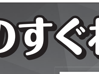
デジタルリスキリング入門の書籍カバー

デジタルリスキリング入門 デジタルスキルを身に付けるべく、提供する。時代の流れに合わせて成長し、価値のある「働」を実現し続けることをサポートする1冊。