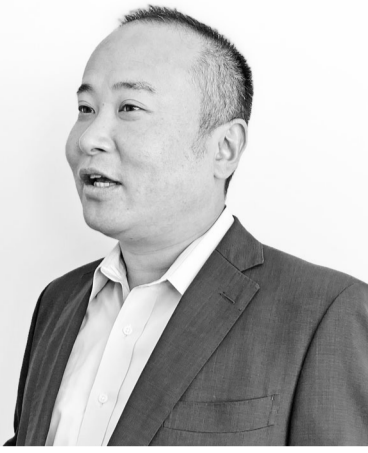
㈱ファンテック (大阪府箕面市) 専務取締役

関西に本社を構える三和建設と三和産業、ファンテックの3社は、企業の枠を超えて業界全体のDXを推進するため「関西建設業界合同勉強会」という名のプロジェクトを開始した。建設会社同士で学ぶ場を創出する取り組みは、ノンプログ